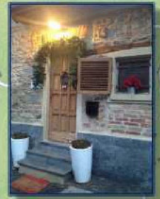
B & B La casa sui tetti