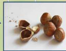
Coop. Agr. San-Giorgio