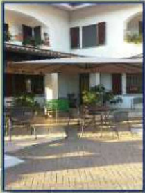
Ristorante Da Maria