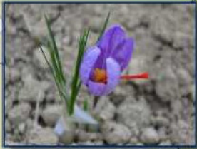
Az. Agr. Stimmi del Monferrato