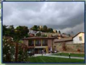
Circolo Il Cortiletto