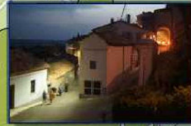
La cantina di Pa